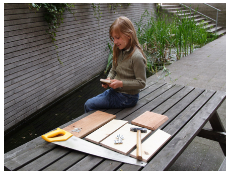
Så er sidestykkerne savet ud.

Sav først bagsiden, forsiden, taget og de to sider ud. Kassen skal være mindst 30 centimeter høj, mindst 10 centimeter dyb og mindst 20 centimeter bred. Vent med at lave bunden til sidst, så kender du kassens præcise størrelse og kan tage mål.