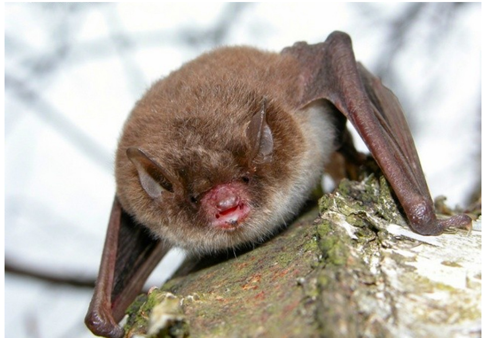
Damflagermus tager sig en lur på et birketræ.