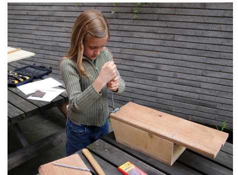
Låget sættes fast med hængsler.

Sæt låget fast med hængsler. Så kan I let komme til at gøre kassen ren. Skru to øskner fast på bagsiden af kassen, så I kan binde den fast på et træ ved hjælp af en snor. Der må ikke bindes for stramt. Træet skal have plads til at vokse. Husk at kontrollere snoren en gang imellem.