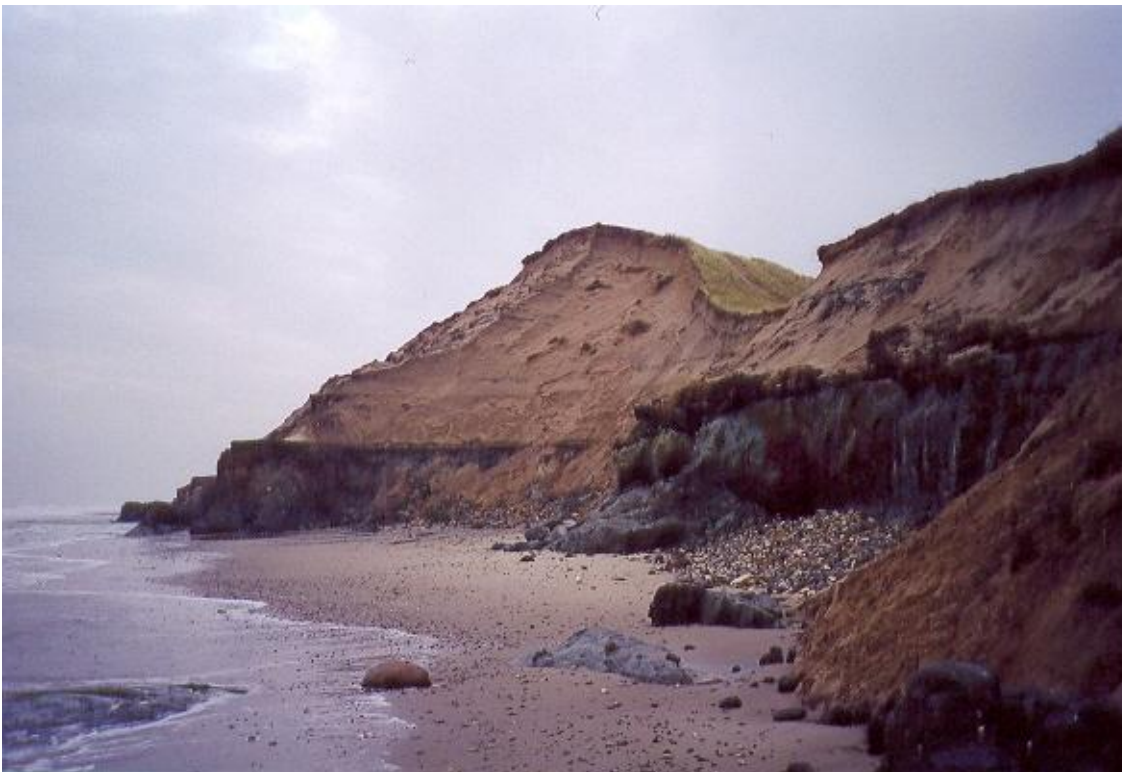
Kysten ved Lodbjerg blotter de tykke sandflugtslag.

Som beskrevet under "Kort om forløbet". Begrundelsen for de konstante flytninger ligger i de forhold, som kystbefolkningen oplevede ved hele tiden at skulle forlade deres marker og ejendomme og begynde et nyt sted.